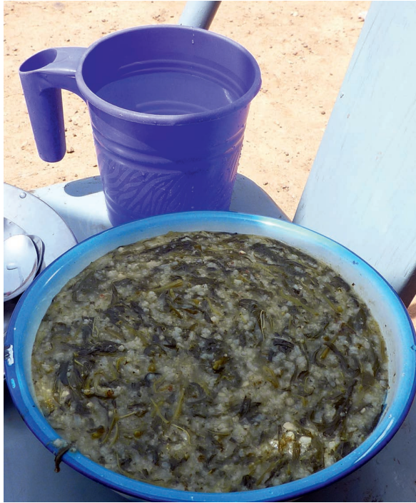
Figure 9.1 : Le bâbenda de Catherine